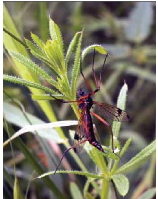
Kammschnake Ctenophora pectinicornis auf Kleb-Labkraut. Wallenhorst, 2.6.2005